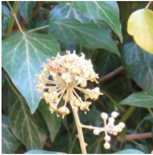
à inconnu observée le 28 septembre 2014 par Tobie Zakia

Réseau Tela botanica, Programme Flora Data, version dynamique.