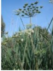
à inconnu observée le 6 juin 2013 par Genevieve Botti

Réseau Tela botanica, Programme Flora Data, version dynamique.