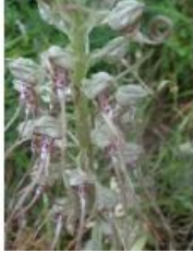
à inconnu observée le 1 juillet 2013 par Genevieve Botti

Réseau Tela botanica, Programme Flora Data, version dynamique.