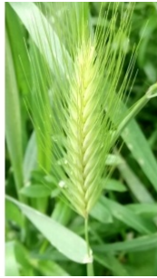
à inconnu observée le 31 mars 2017 par Christophe Gorla

Réseau Tela botanica, Programme Flora Data, version dynamique.