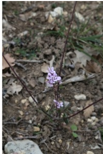
à inconnu observée le 20 mars 2016 par I-hote.catherine@...

Réseau Tela botanica, Programme Flora Data, version dynamique.