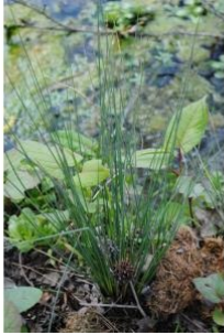
à inconnu observée le 6 avril 2016 par Romain Desgré

Réseau Tela botanica, Programme Flora Data, version dynamique.