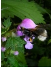
à inconnu observée le 23 mai 2006 par David Delbos

Réseau Tela botanica, Programme Flora Data, version dynamique.