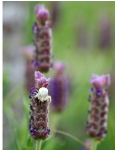
à inconnu observée le 20 juillet 2012 par Véronique Nolan

Réseau Tela botanica, Programme Flora Data, version dynamique.