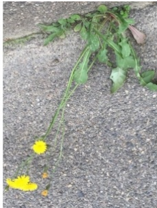
à inconnu observée le 3 avril 2015 par Louis Amandier

Réseau Tela botanica, Programme Flora Data, version dynamique.