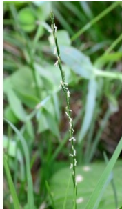
à inconnu observée le 6 juillet 2018 par Michel Pansiot

Réseau Tela botanica, Programme Flora Data, version dynamique.