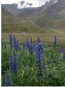
à inconnu observée le 20 janvier 2007 par Genevieve Botti

Réseau Tela botanica, Programme Flora Data, version dynamique.