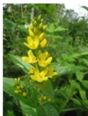
à inconnu observée le 18 juillet 2012 par Saumurette

Réseau Tela botanica, Programme Flora Data, version dynamique.