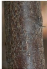
à inconnu observée le 30 mars 2012 par Hervé Goëau

Réseau Tela botanica, Programme Flora Data, version dynamique.