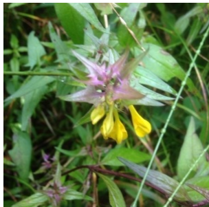
à inconnu observée le 5 août 2016 par Giovanni Leonardi

Réseau Tela botanica, Programme Flora Data, version dynamique.