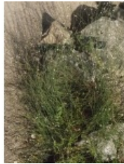
à inconnu observée le 26 octobre 2013 par Liliane Roubaudi

Réseau Tela botanica, Programme Flora Data, version dynamique.