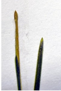
à inconnu observée le 3 juillet 2019 par GLev

Réseau Tela botanica, Programme Flora Data, version dynamique.