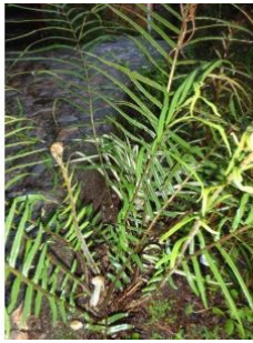
à inconnu observée le 23 janvier 2010 par Genevieve Botti

Réseau Tela botanica, Programme Flora Data, version dynamique.