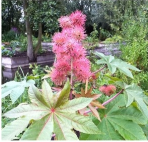
à inconnu observée le 20 juillet 2014 par Matthieu Boll

Réseau Tela botanica, Programme Flora Data, version dynamique.