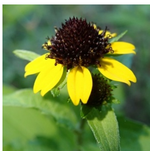
à inconnu observée le 21 septembre 2017 par Michel Monteil

Réseau Tela botanica, Programme Flora Data, version dynamique.