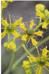
à inconnu observée le 29 mai 2014 par Guillaume Blondeau

Réseau Tela botanica, Programme Flora Data, version dynamique.