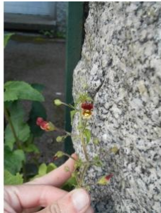
à inconnu observée le 14 mai 2014 par Camila Leandro

Réseau Tela botanica, Programme Flora Data, version dynamique.