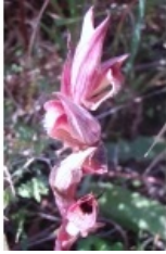
à inconnu observée le 28 mai 2012 par Genevieve Botti

Réseau Tela botanica, Programme Flora Data, version dynamique.