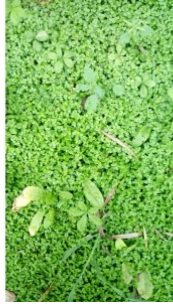
à inconnu observée le 6 mai 2017 par Christophe Gorla

Réseau Tela botanica, Programme Flora Data, version dynamique.