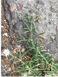
à inconnu observée le 4 mai 2015 par louis.amandier@...

Réseau Tela botanica, Programme Flora Data, version dynamique.