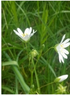
à inconnu observée le 1 mai 2014 par Jean-François Molino

Réseau Tela botanica, Programme Flora Data, version dynamique.