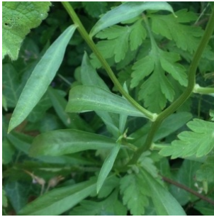
à inconnu observée le 26 mai 2015 par ericalens

Réseau Tela botanica, Programme Flora Data, version dynamique.