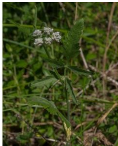
à inconnu observée le 11 juin 2017 par Pierre Crouzet

Réseau Tela botanica, Programme Flora Data, version dynamique.