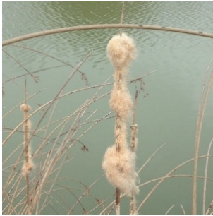
à inconnu observée le 17 mars 2014 par Hervé Goëau

Réseau Tela botanica, Programme Flora Data, version dynamique.