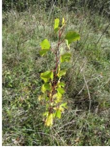
à inconnu observée le 8 septembre 2014 par Marie-France Petibon

Réseau Tela botanica, Programme Flora Data, version dynamique.