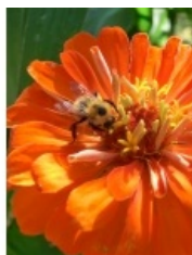
à inconnu observée le 12 juillet 2012 par Epicurium

Réseau Tela botanica, Programme Flora Data, version dynamique.