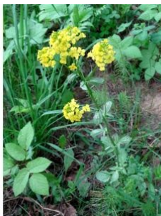
à inconnu observée le 22 mai 2019 par Alain Bigou

Réseau Tela botanica, Programme Flora Data, version dynamique.