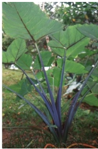
à inconnu observée le 22 janvier 2004 par Liliane Roubaudi

Réseau Tela botanica, Programme Flora Data, version dynamique.