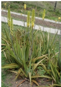
à inconnu observée le 25 février 2017 par Liliane Roubaudi

Réseau Tela botanica, Programme Flora Data, version dynamique.