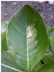
à inconnu observée le 3 juin 2015 par Anziz

Réseau Tela botanica, Programme Flora Data, version dynamique.