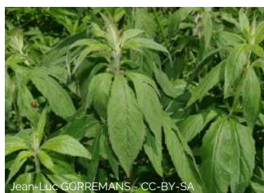
Eupatoire à feuilles de chanvre

Eupatorium cannabinum 60-120 cm, feuilles lancéolées et dentées