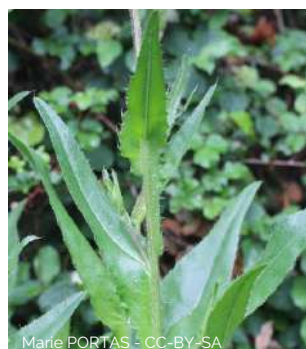
Cirse de Montpellier

Cirsium monspessulanum 50-120 cm, feuilles glabres, non piquantes, fleurs blanches à pourprées