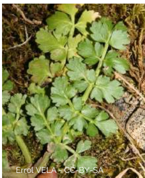
Oenanthe de Lachenal

Oenanthe lachenalii 50-80cm, tiges très minces, groupes de 7 à 12 fleurs