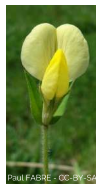
Lotier à gousses carrées

Lotus maritimus 10-30 cm, poilue, 3 folioles et 2 stipules identiques, fleurs de 2,5cm