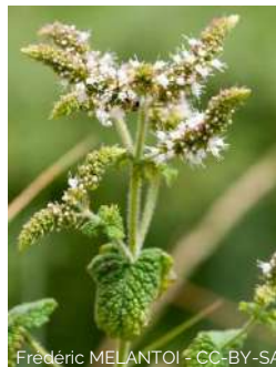
Menthe à feuilles rondes

Mentha suaveolens Feuilles gaufrées, groupes de fleurs spiciformes