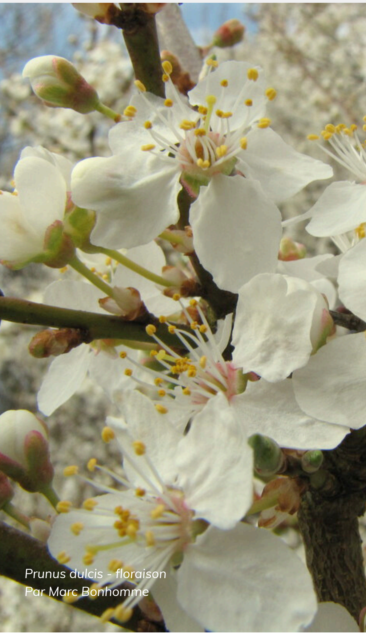
Prunus dulcis - floraison Par Marc Bonhomme